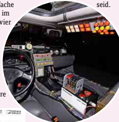
Auch im Inneren des legendären Flügeltüres gleicht jedes Detail der Filmvorlage.