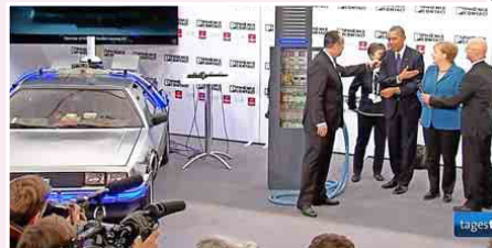
Den Freiburger DeLorean bewundern sogar Kanzlerin Angela Merkel und der amerikanische Präsident Barack Obama bei der Hannover Messe – so hat es das Kultauto bis in die Tagesthemen geschafft – und Angela Merkel bekommt „Zurück in die Zukunft“ vom Chef des Weißen Hauses jetzt auf DVD.